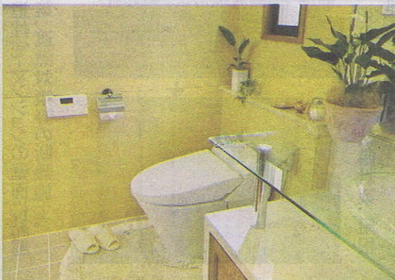
観葉植物で木の氣を強め、アロマストーンで天然アロマの香りを漂わせて良い風を感じさせるのも◎ (インドアグリーン協力：榊原農園)